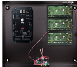
ENCL2-PS sin puerta