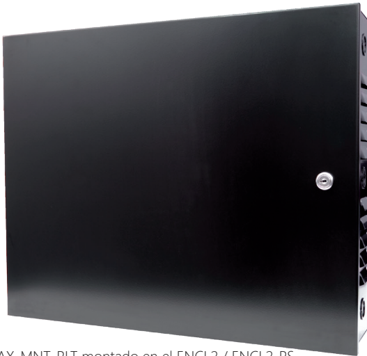
* AX-MNT-PLT montado en el ENCL2 / ENCL2-PS