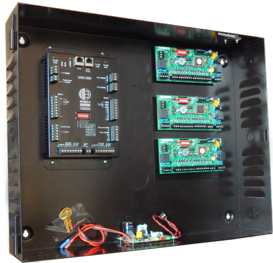
* AX-MNT-PLT montado en ENCL2-PS con tres NURC-2002-B